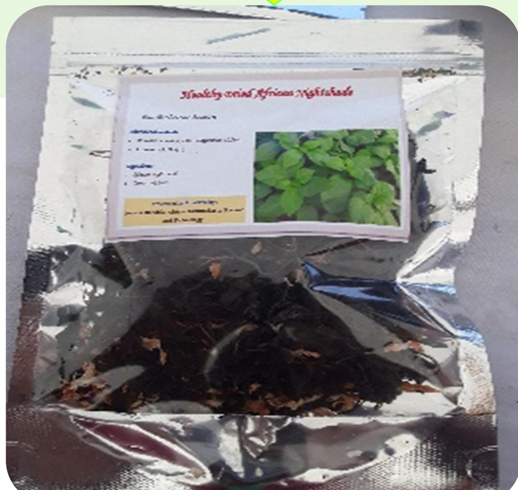
Kifungashio cha mnavu uliokaushwa chenye plastiki