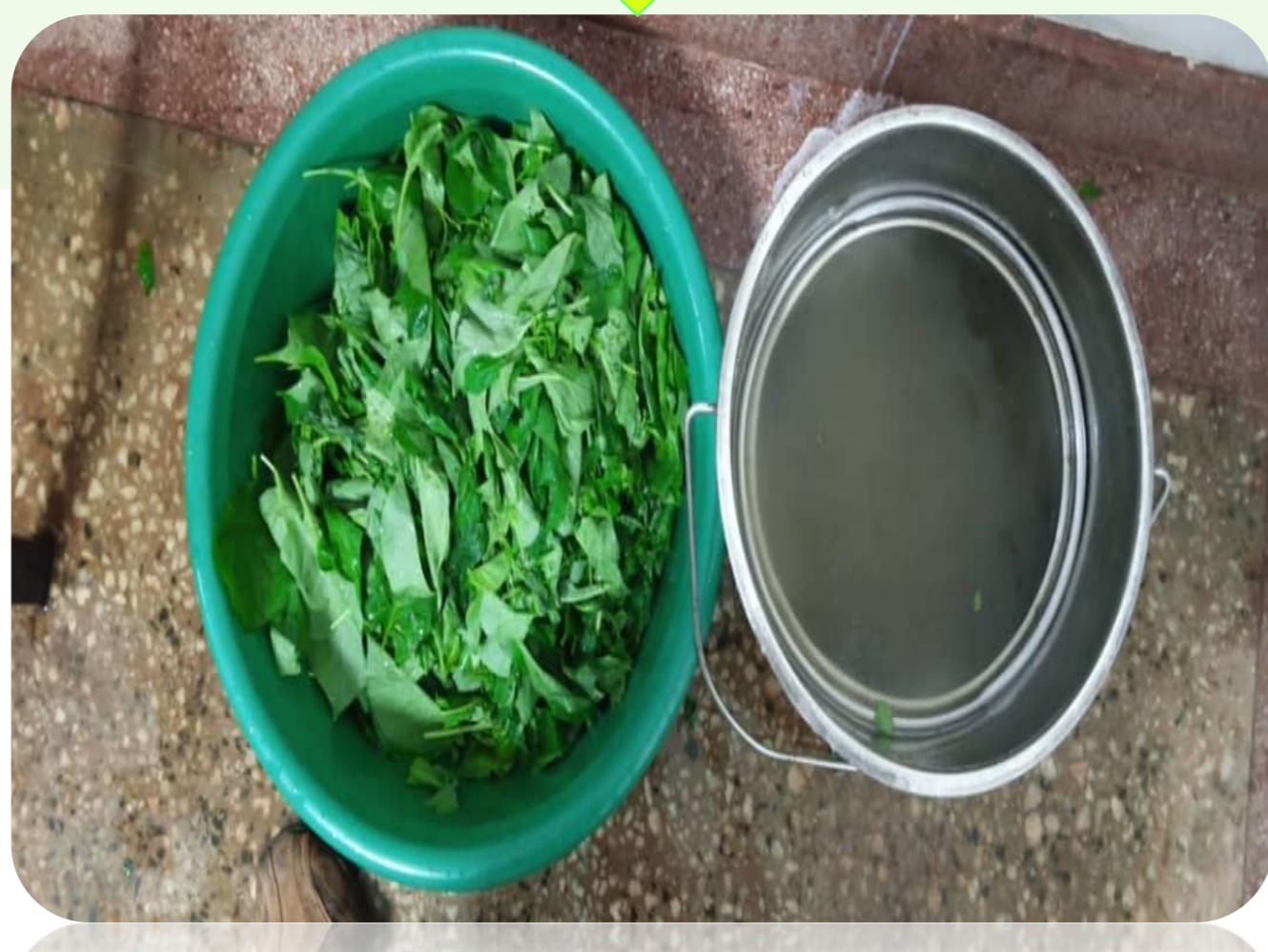
Uoshaji wa mnavu