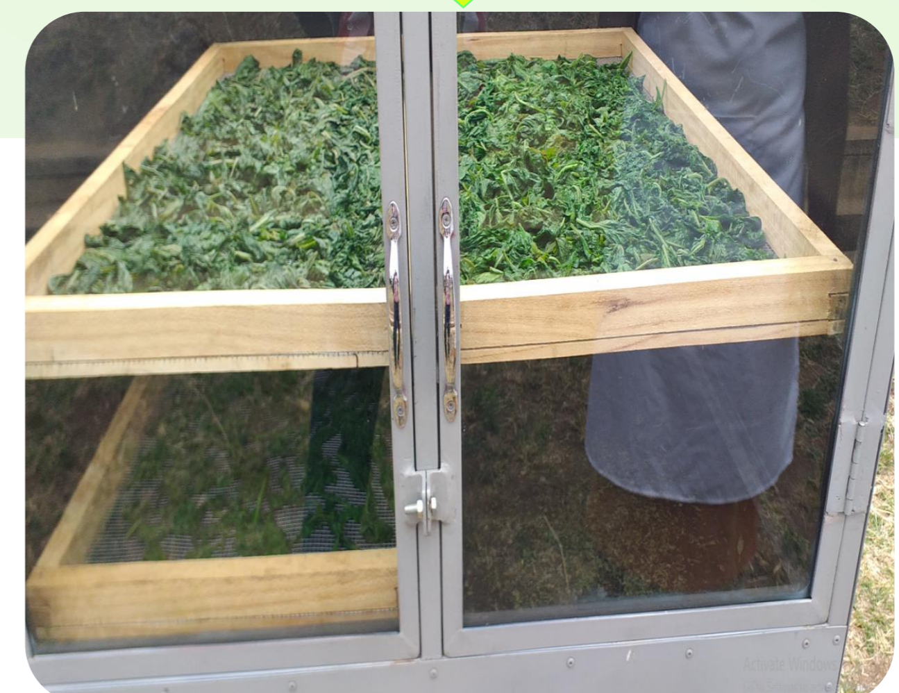
Ukaushaji wa mnavu