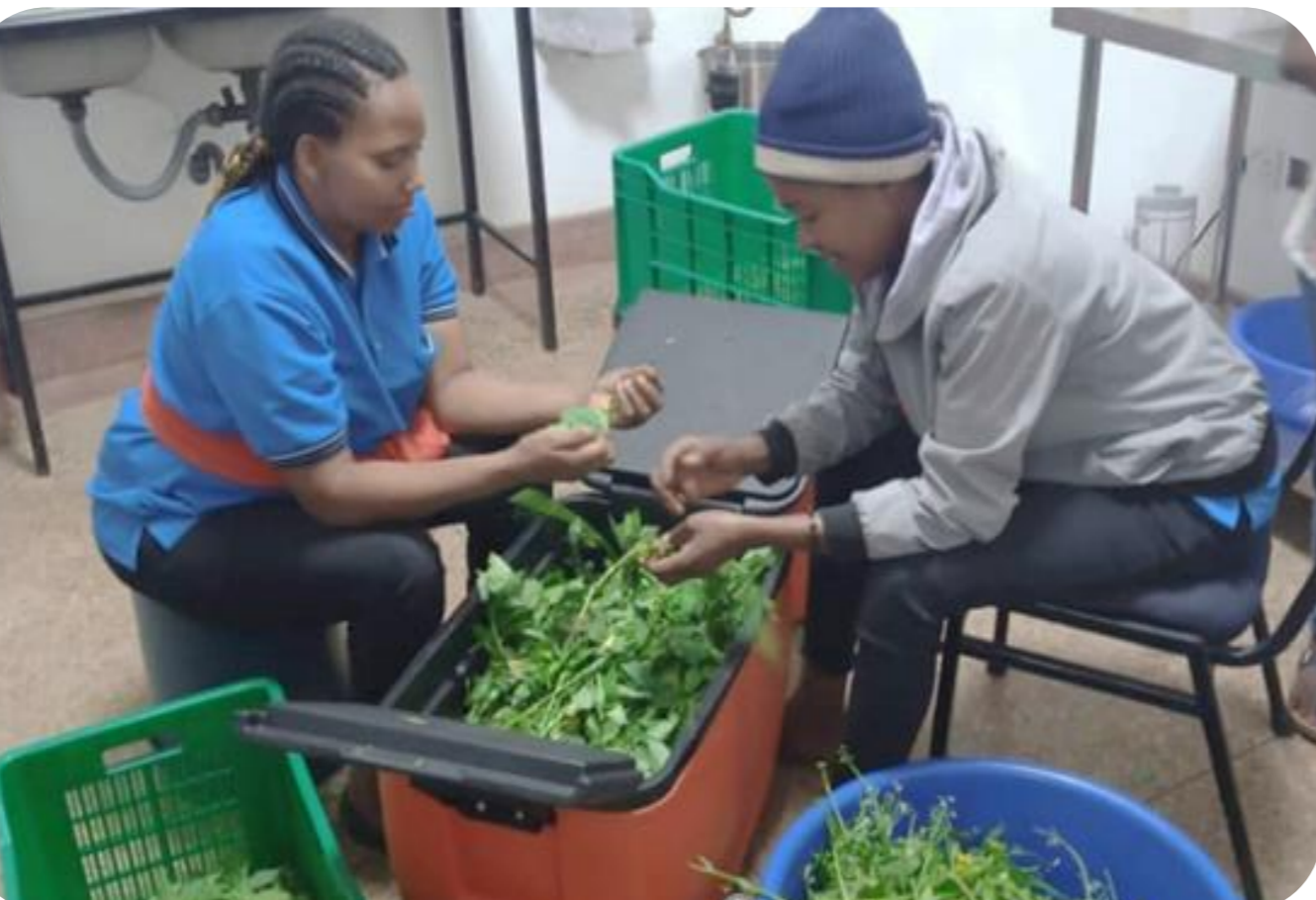
Uchambuzi wa mnavu