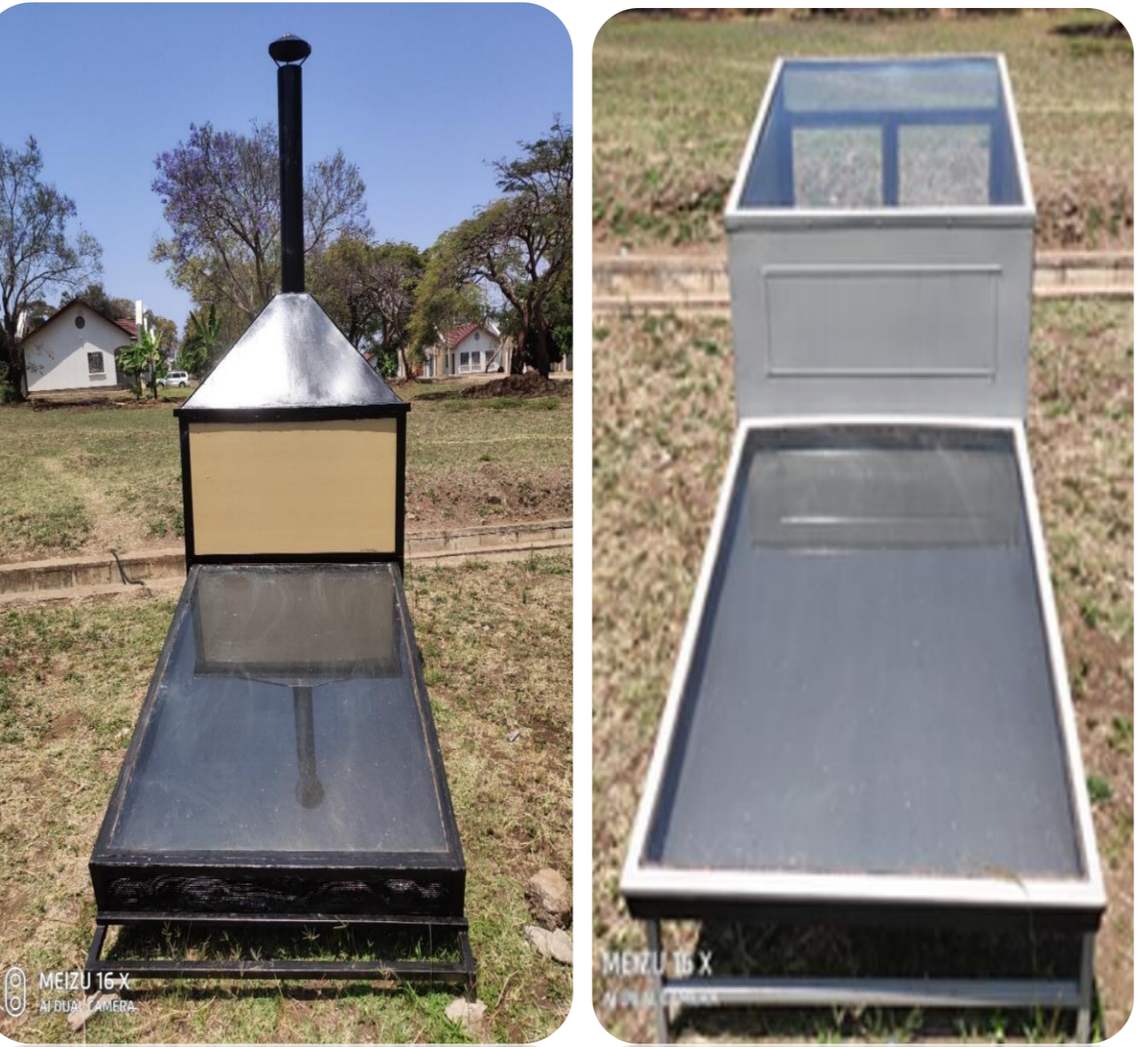
Vikaushio jua