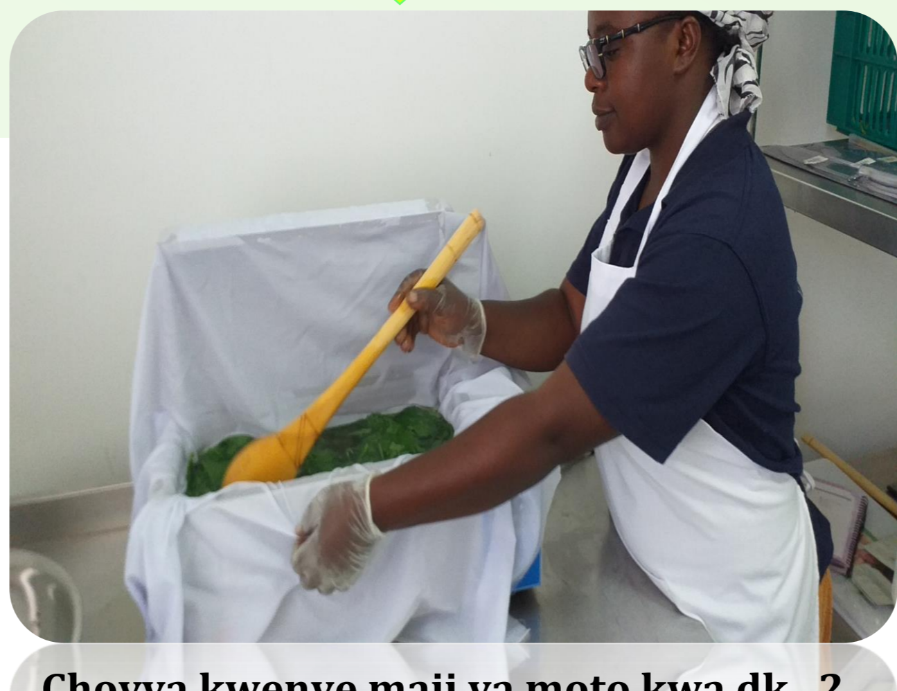
Chovya kwenye maji ya moto kwa dk. 2