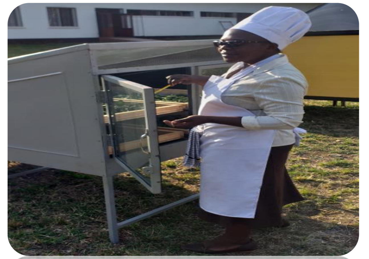
Ugeuzaji Kazosi mnavu ili kuruhusu ukauke vizuri