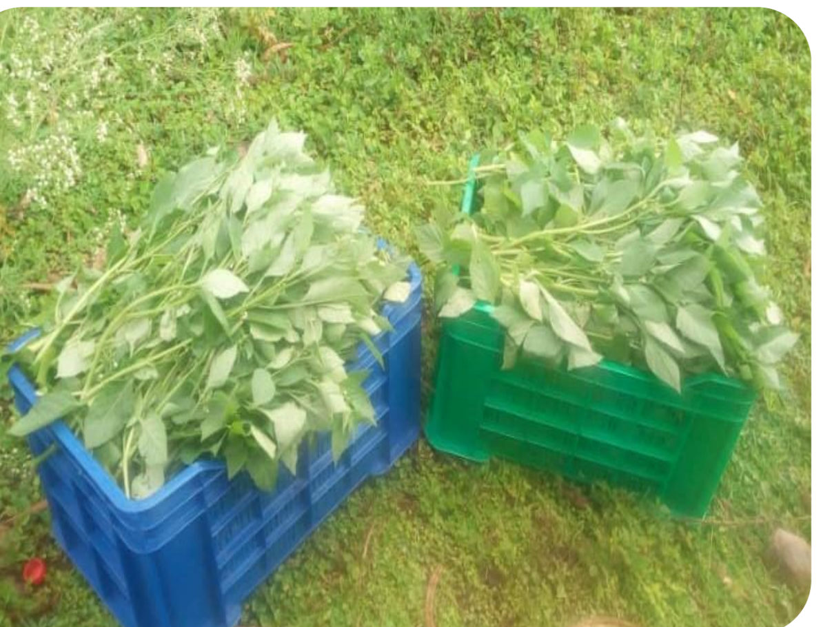
Ukusanyaji kwenye kreti