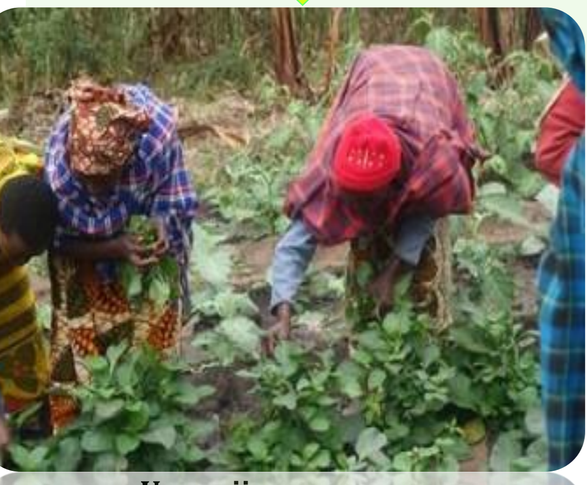
Uvunaji wa mnavu