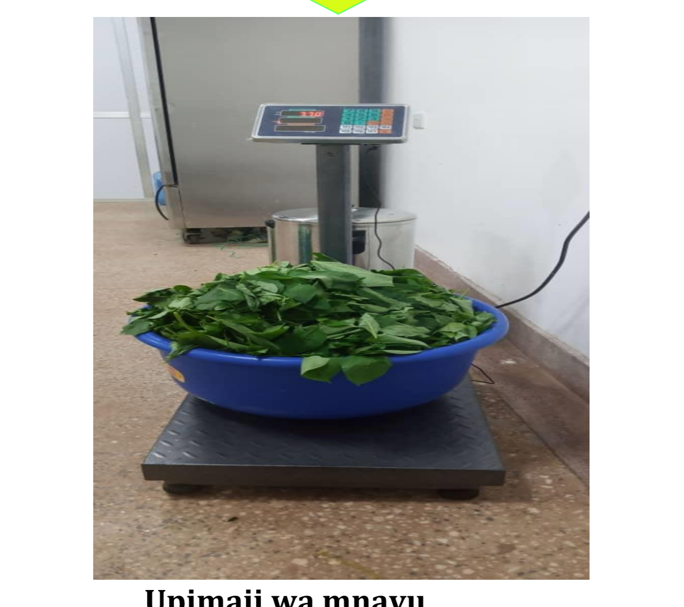
Upimaji wa mnavu uliochambuliwa