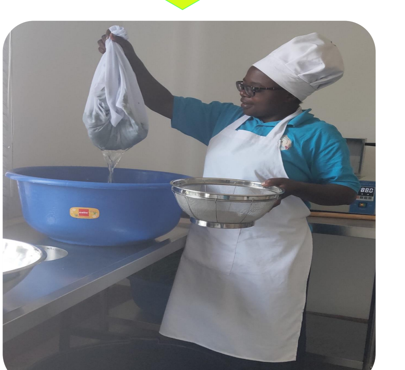
Chuja mnavu © Marynurce Kazosi