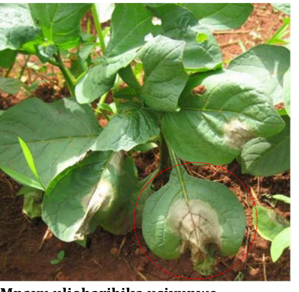
Mnavu ulioharibika usivunwe © Nono-Womdimbo et al. (2009)