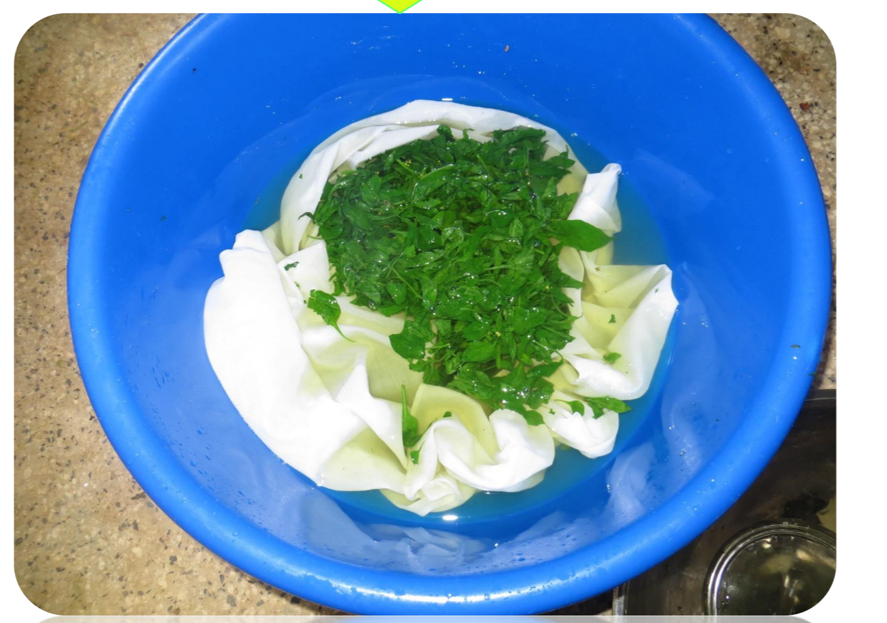
Pooza kwenye maji ya baridi yenye chumvi